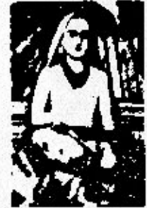
தென் பாண்டித் தமிழர் ஞானசித்தர் ஆதிசங்கரர்

64 வது நாயனாராகத் திரு அவதாரம் செய்த தமிழின உணர்வை ஊட்டிய சொல்லடி நாயனார் தந்தை பெரியார் ஈ. வெ. ரா.