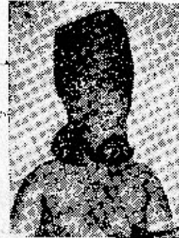
ஞாலகுரு சித்தர் கருவூரர் 12 வது பதினெண் சித்தர் டீடாதிபதி