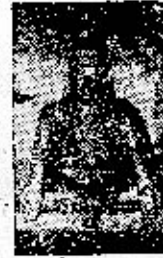
சித்தர் காவிரி யாற்றங்கரைக் கருவூரர்

கோபீயக்கி அருள்மிகு சொல்லடி நாயனார் பெரியார் ஈ. வெ. ரா.