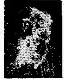
தமிழினத் தலைவர் சொல்லடி நாயனார் பெரியார் ஈ. வெ. ரா.