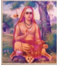
வெள்ளாடை மேனியான், தென்பாண்டித் தமிழன், ஞானசித்தர் ஆதிசங்கராச்சாரியார்