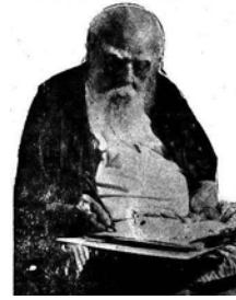
இ.ம.இ. கௌரவத் தலைவர் 64வது நாயனார் சொல்லடி நாயனார் பெரியார் ஈ.வெ.ரா.

இந்து மறுமலர்ச்சி இயக்கம் (இ.ம.இ.) தோற்றம்: கி.பி. 1772 INDU MARUMALARCHI IYAKKAM (I.M.I.) Founded: : 1772 A.D.