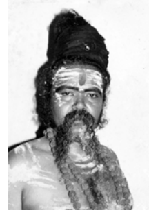
அருளாட்சி நாயகம், இந்துமதத் தந்தை, ஞானாச்சாரியார், 12வது பதினெண் சித்தர் பீடாதிபதி, குருமகா சன்னிதானம் ஞாலகுரு சித்தர் அரசயோகி கருவூறார்