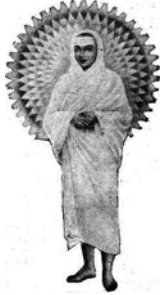
ஞானசித்தர் வேதசித்தர் அருட்பெருஞ்சேதி வடலூர் இராமலிங்க அடிகளார்