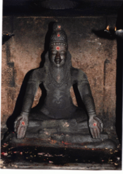
தஞ்சைப் பெரிய கோயிலைக் கட்டிய 11வது பதினெண் சித்தர் பீடாதிபதி குருமகா சன்னிதானம் ஞாலகுரு சித்தர் காவிரியாற்றங்கரைக் கருவூறார்